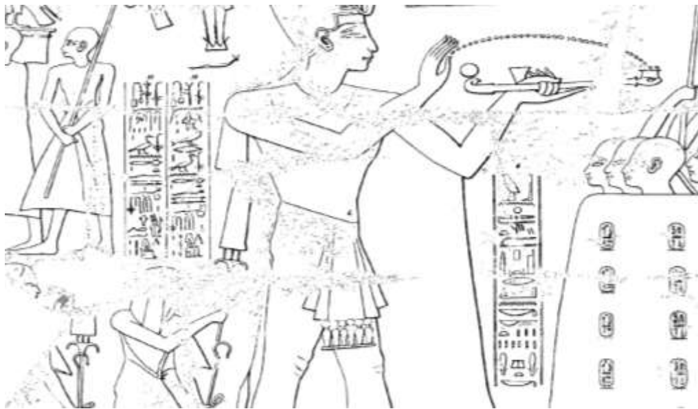
Detail van het Amon-Kamoetef festival uit de barkkapel van Ramses III in Karnak.

Op een scene in de barkkapel van Ramses III in de tempel van Karnak is een prins met dezelfde titels aangebracht. Hier is in tegenstelling tot in Medinet Habu wel de eigenaam van de prins aangebracht.