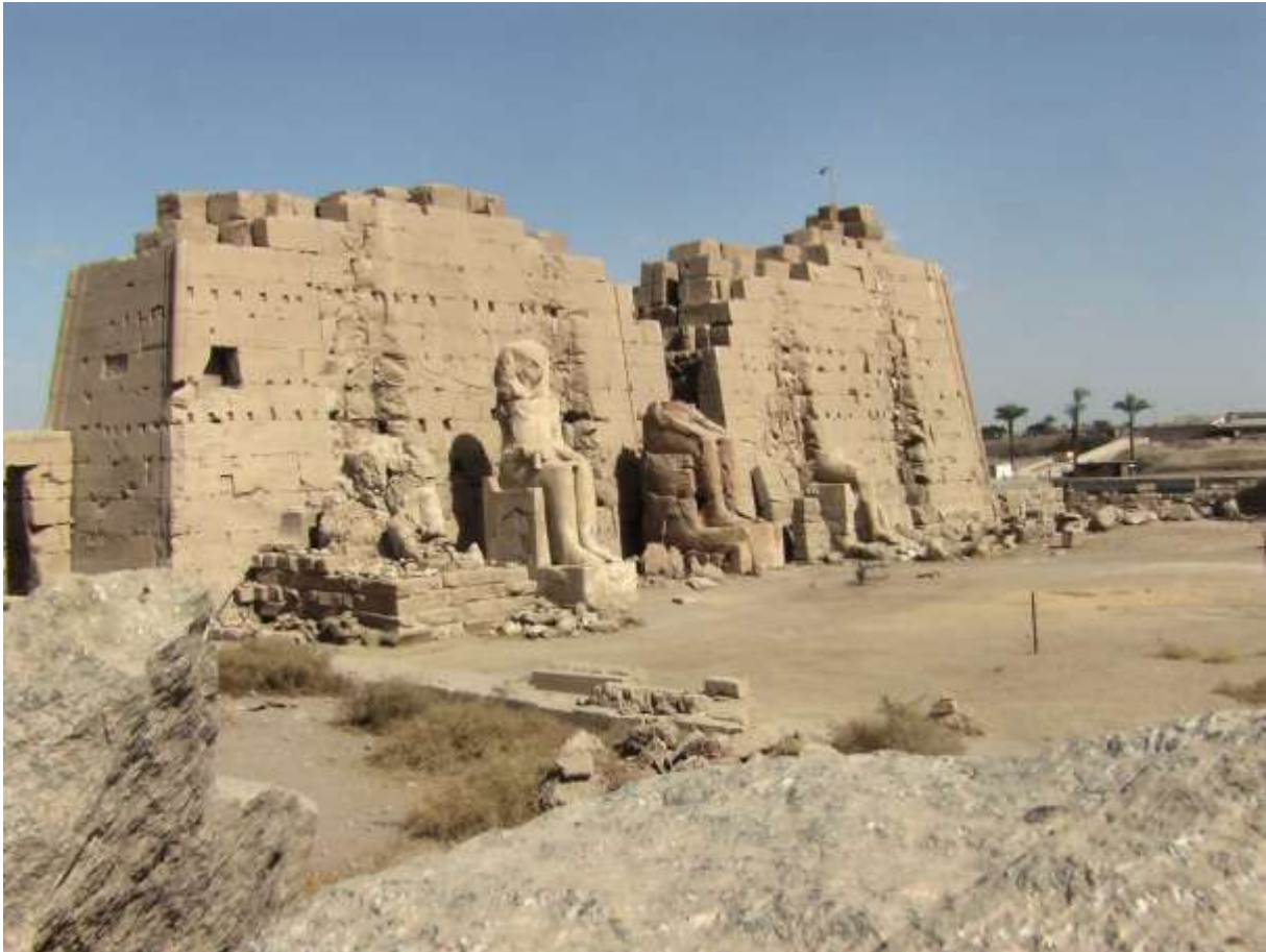
De Achtste pyloon van de tempel van Karnak. Deze toegangspoort werd door Hatsjepsot gebouwd op de noord-zuid as van de tempel.

Wat we tegenwoordig als het tempelgebouw beschouwen, is eigenlijk een opeenvolging van pylonen (toegangspoorten), hoven en portalen die naar het binnenste van de tempel leiden. Daar was het heilige der heiligen, de woning van de godheid.